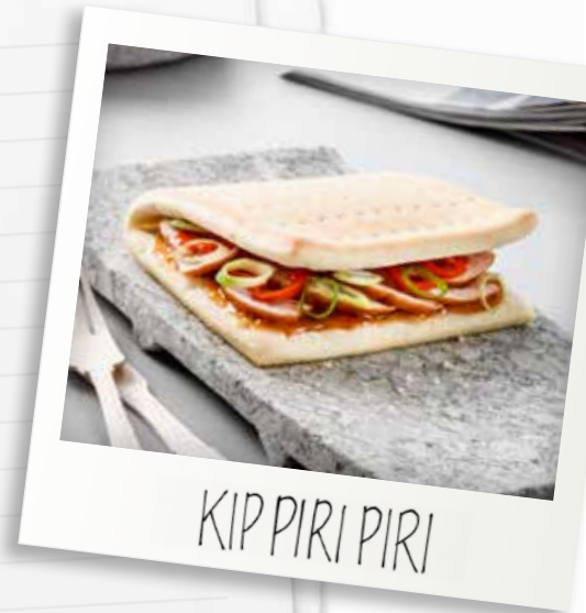
KIP PIRI PIRI